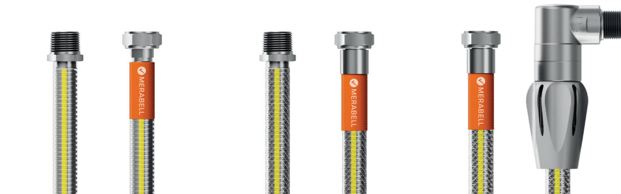
CELONEREZOVÁ HADICE CLASSIC