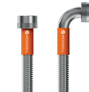
СЕЛОНЕРЕЗОВА ХАДИСЕ ПРАЧКОВА