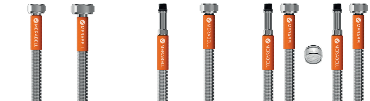
СЕЛОНЕРЕЗОВА ХАДИСЕ ТОВАЛЕТНІ